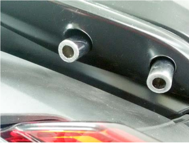
Mounting pic 1