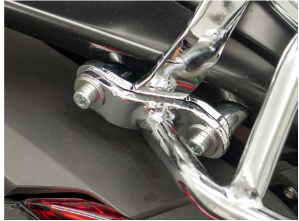
Mounting pic 1A